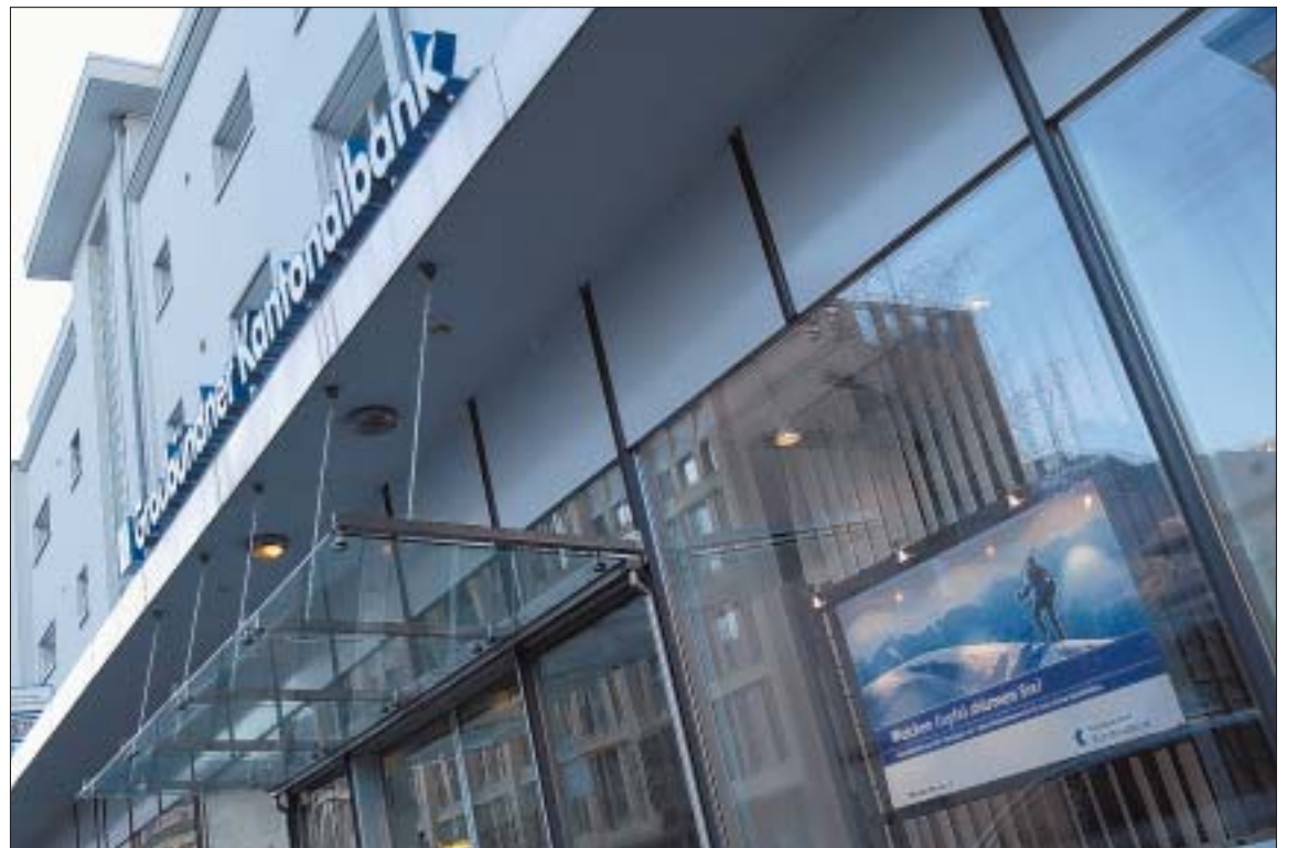
Die GKB (hier Regionalsitz Landquart) hat einen weiteren Gipfel gestürmt ...

Vom Rekordergebnis profitieren auch die PS-Inhaber und der Kanton. Die Dividende auf dem Nominalkapital wird um weitere zwei auf 26 Prozent erhöht. Obwohl das Nominalkapital aufgrund der im letzten Jahr erfolgten Rückzah-