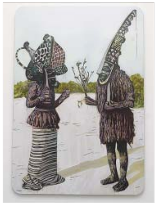
Kultureller Austausch mit Symbolhaftigkeit: Bild von Giuseppe Corciulo. (tam)