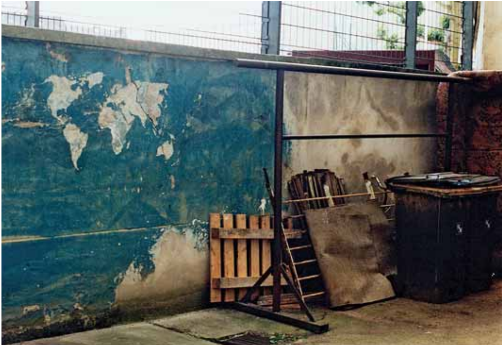
Vexierbild: Die Welt entdecken, 2001–2003, Weltkartenleck im öffentlichen, privaten und Ausstellungsraum, Berlin