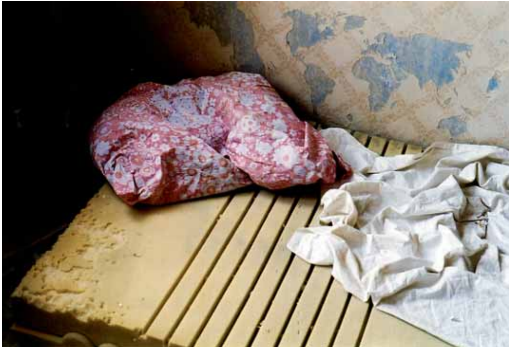
Mikrokosmos: Weltraum, 2002, Rauminstallation in leerstehendem Akademiegebäude in Berlin, diverse Materialien

Grundausbildung in Visueller Kommunikation an der HGK Luzern, für die bildende Kunst entschieden. 1999 erhält sie das Berliner Atelier des Kantons Freiburg zugesprochen: Das ist eine Bestätigung der ersten Versuche und der Startschuss, mit der bildenden Kunst endgültig ernst zu machen. Wie schon für viele vor ihr wird die Stadt für ein paar Jahre ihr Lebensraum. Hier findet sie auch ein ideales Terrain für ihre Kunst.