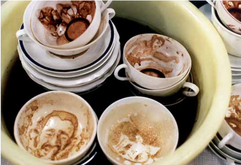
Weltpolitik zum Frühstück: Unerledigt, 2003–2007, Milchkafee und Kakao auf Porzellan, getrocknet (weinender irakischer Soldat, Bush u.a.)