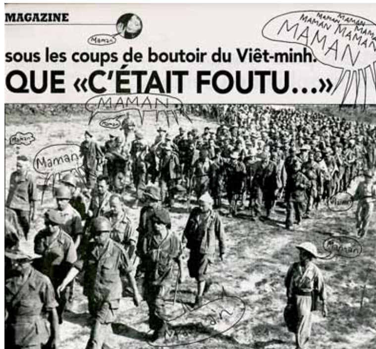
Maman, 2004, Intervention in der Tageszeitung La Liberté zum Muttertag, 8. Mai 2004