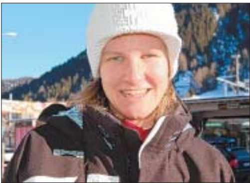
Strahlende Siegerin: Daniela Meuli hat nicht mit dem Wahlsieg gerechnet.

Zum zweiten Mal in Folge haben die BT-Leserinnen und -Leser die Davoser Alpinboarderin Daniela Meuli zur Bündner Sportlerin des Jahres gewählt. Strahlend hat sie die Siegesprämie von 1000 Franken entgegengenommen. Da sie im August – wenige Monate nach ihrem Sieg im Parallel-Riesenslalom an den Olympischen