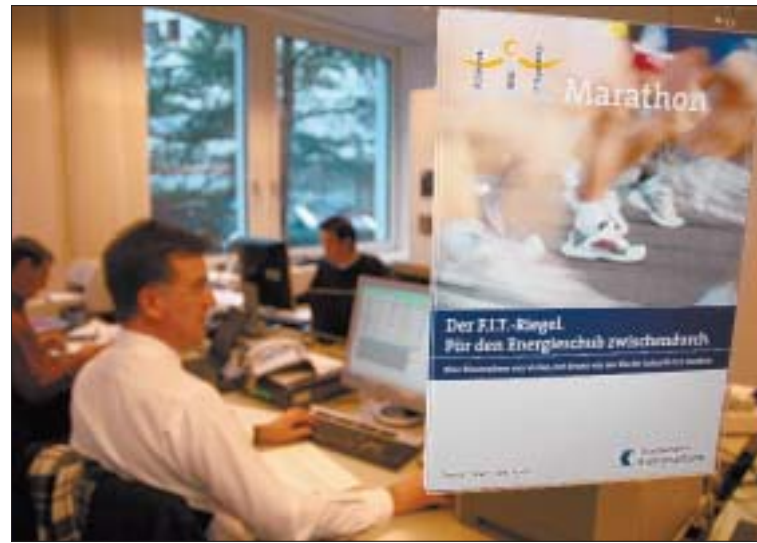
Durchhalteparolen: Mit Energieriegeln werden die Mitarbeiter der Informatiksystempartner fit gehalten.