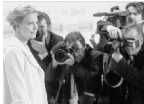
Im Mittelpunkt der Fotografen: Preisträgerin Charlize Theron.

Im Rahmen einer festlichen Gala ist am Donnerstagabend in Berlin die 41. «Goldene Kamera» verliehen worden. Der Preis in der Kategorie «Film international» ging an Oscar-Preisträgerin Charlize Theron. Die 30-jährige Südafri-