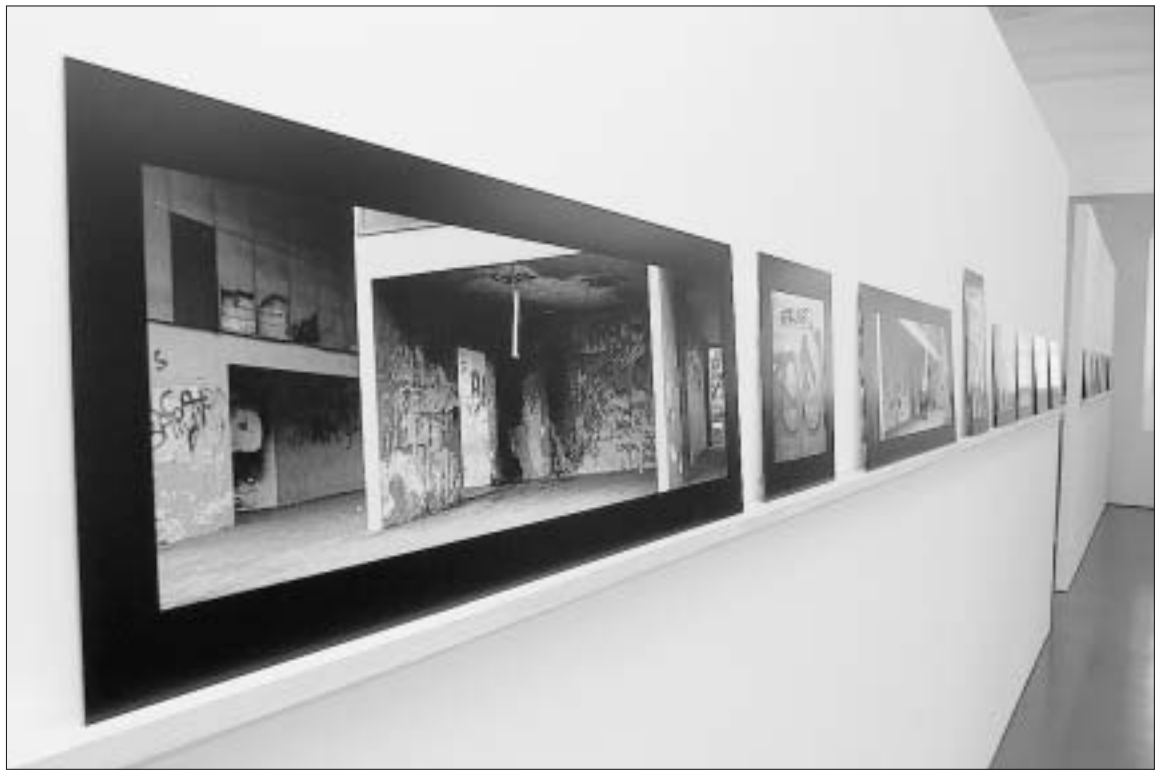
Heruntergekommene Betonbauten der Banlieues, abblätternde Farbschichten, Graffiti: Fotografische Arbeiten von Gaudenz Signorell aus den Jahren 2003 bis 2005.

Die Aufnahmen zeigen heruntergekommene Betonbauten der Banlieues. Abblätternde Farbschichten, Graffiti und Verschrundungen an den Wänden lassen ein «anderes» Paris entdecken – eine jener Vorstädte, in denen im Herbst