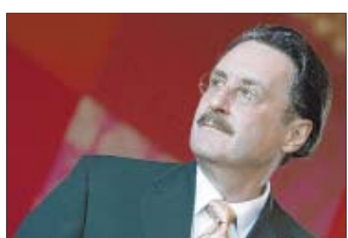
Landesmuseums-Direktor Furger. (Ky)