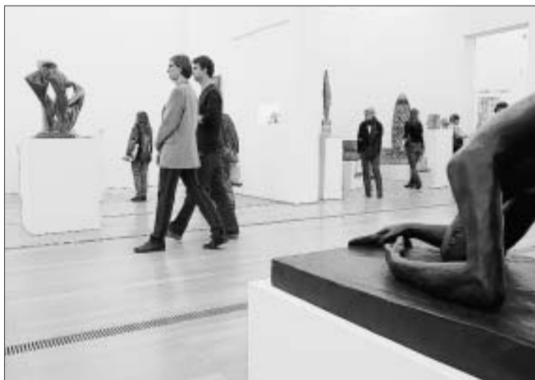
Ein Blick in die neue Ausstellung in Riehen.

Die Ausstellung dauert vom Sonntag, 3. Oktober, bis zum 30. Januar 2005.